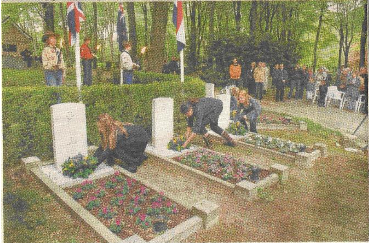
ROZENDAAL - Kinderen van de Dorpsschool in Ro- het dorp werd neergehaald. De zeven Britten en zendaal het belang onderstreept van het betrek-

Namens de gemeente Rozendaal organiseren wij jaarlijks ook de bloemlegging door de kinderen van de Dorpsschool. Zij leggen bij de dodenherdening in Rozendaal bloemen bij de graven van de bemanningsleden van de bommenwerper die in 1943 boven het dorp werd neergehaald. De zeven Britten en een Nieuw-Zeelander liggen op de begraafplaats Roosendaal. Bloemisterij Beekhuizen neemt altijd een deel van de kosten van de Amnestyboeketten in Velp en Rozendaal voor haar rekening.