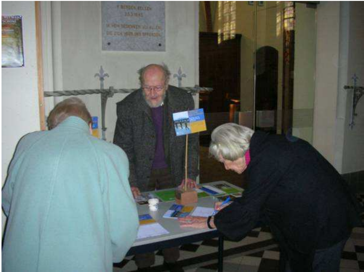
Foto: schrijfactie in OLVV Velp