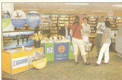
* Leden van Amnesty Velp - Rozendaal in actie in de Velpse bibliotheek

Het werk van Amnesty is in de loop der jaren wel veranderd en daarmee ook het beeld dat mensen van de groep hebben: "Vroeger werden we gezien als linkse rooie rakkers, maar dat is gelukkig wel veranderd. Het enige dat Amnesty wil, is dat de mensen-